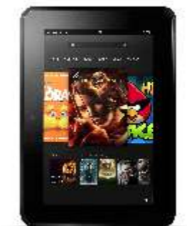
Kindle Fire HD 7 Tablet

Sie haben schon einen Kindle Fire HD 7 Tablet? Dann gibts alternativ einen Gutschein unserer regionalen Kooperationspartner VR-BankCard PLUS oder einen Amazon-Gutschein im Wert von 100 €.